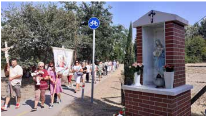
Kisboldogasszony ünnepe a Putyi tejsarnoknál