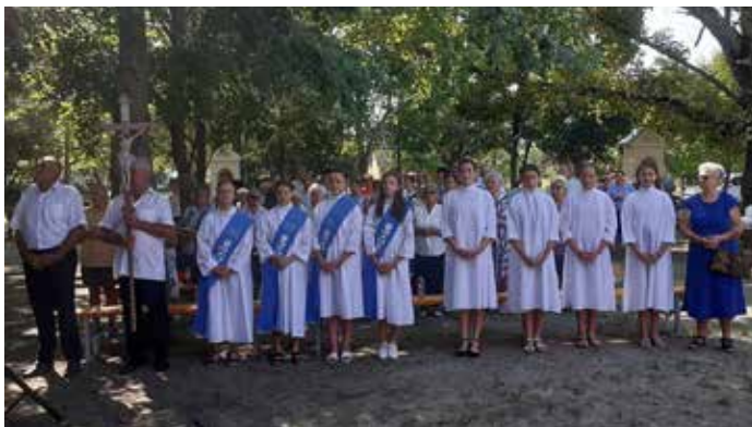
Máriás lányok Nagyboldogasszony ünnepén